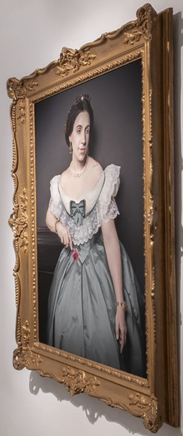
Portrait of a woman in a white and grey costume.