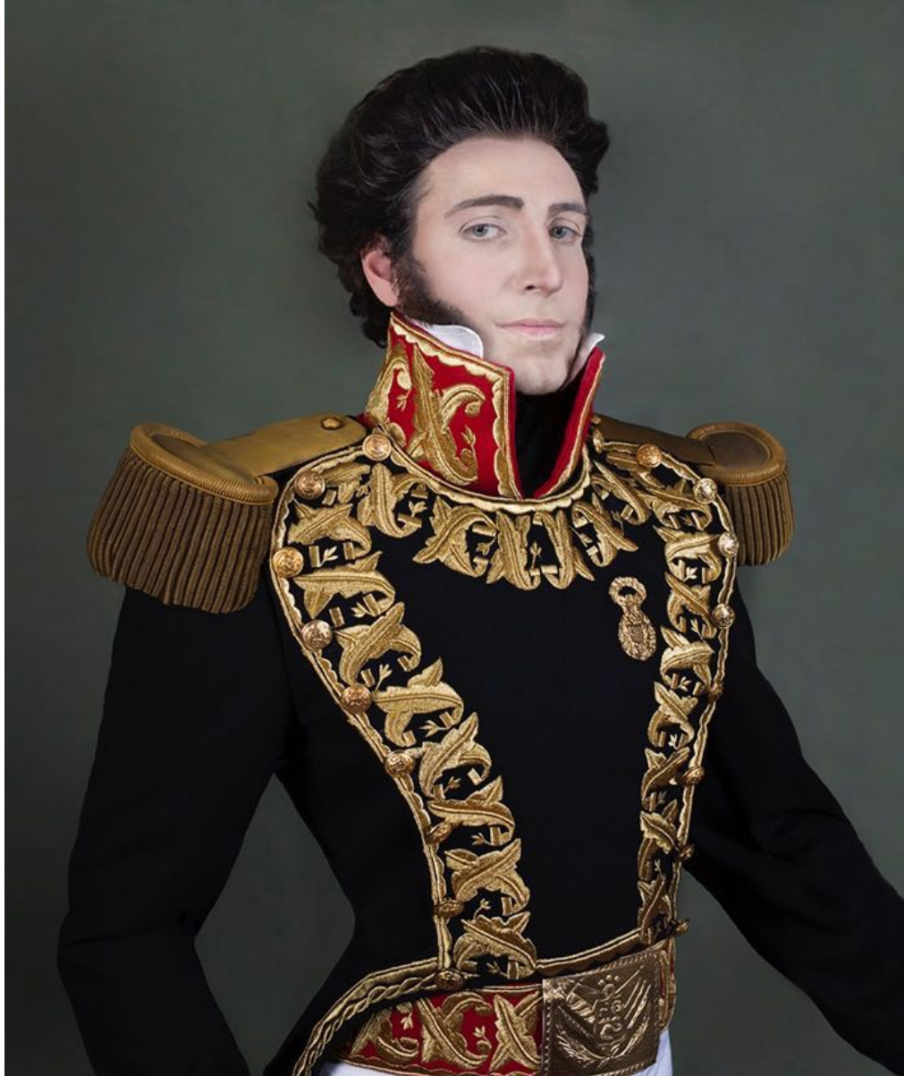
Don Juan Bautista Elespuru y Montes de Oca. (Quinto abuelo)

Autoretrato, fotografía digital, 61x53cm, (1/5) 2014. 2500€ + iva