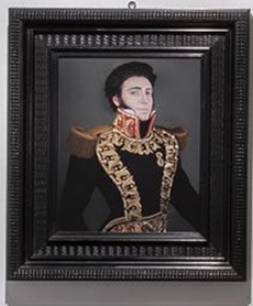
Portrait of a man in a black and gold costume.