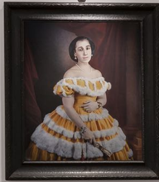
Portrait of a woman in a yellow and white dress, likely a reproduction of a work by the artist.