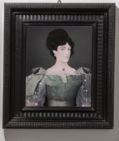
Portrait of a woman in a green and black costume.