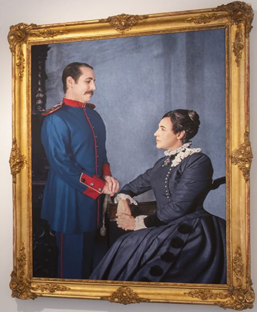
Portrait of a man and a woman in 19th-century attire. The man is wearing a blue military uniform with red accents, and the woman is wearing a dark blue dress with a white lace collar. The portrait is mounted on a white wall in a gallery hallway.