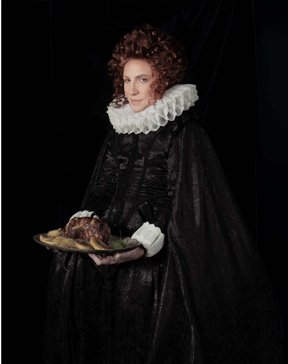
Doña Catalina de los Ríos y Lisperguer “La Quintrala” (1604-1665) 2023 112x 89 cm