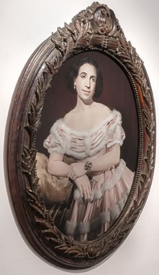
Portrait of a woman in a pink and white dress, likely a reproduction of a work by the artist.